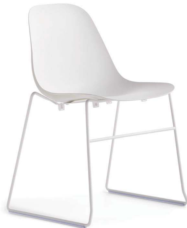
Pola Light R __ SB Sedia / Chair Base a slitta / Sled base