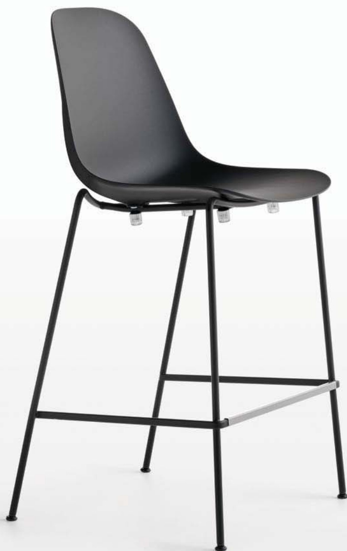
Pola Light 65 — 4L Sgabello / Stool Impilabile / Stackable