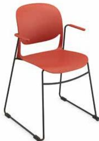
OUTLINE 610 SKID WITH ARMS