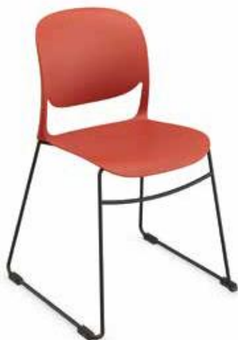
OUTLINE 610 SKID