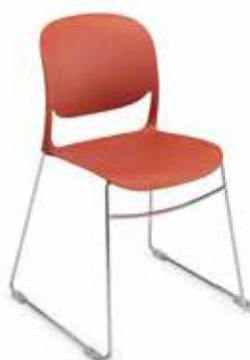
VERSIONE POLIPROPILENE POLYPROPYLENE VERSION