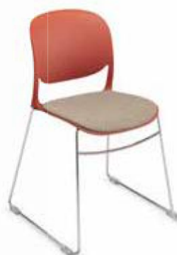
VERSIONE POLIPROPILENE PER PANNELLINO SEDILE PER TAPPEZZERIA POLYPROPYLENE VERSION FOR SEAT PANEL FOR UPHOLSTERY