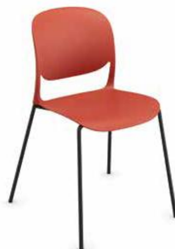
OUTLINE 610 4 LEG

Impilabilità, su carrello con inclinazione a 45° fino a 40 sedie (solo per versione slitta) High density stacking 40 chairs on a trolley (for skid version only)