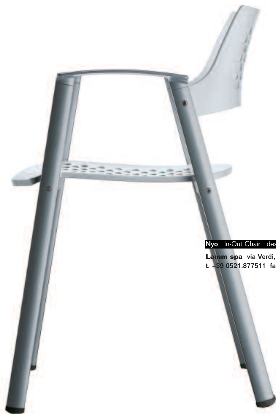
Nyo In-Out Chair design Justus Kolberg

Lamm spa via Verdi, 19/21 43017 San Secondo Parmense (Pr), Italy t. +39 0521.877511 fax +39 0521.877599 www.lamm.it info@lamm.it