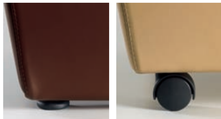
Ruote in nylon nero, piedini regolabili in termoplastica nera. Castors in black nylon, adjustable feet in black thermoplastic.